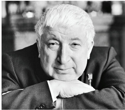
Празднование юбилея поэта за рубежом

Крупные российские библиотеки также проведут в юбилейный год поэта несколько выставок. В частности, в Российской государственной библиотеке в сентябре откроется книжно-иллюстративная выставка «К 100-летию Р. Г. Гамзатова», книжная выставка, в том числе изданий в специальных форматах для слепых и слабовидящих, приуроченная к юбилею поэта, пройдет осенью в Российской государственной библиотеке для слепых. Еще одна книжно-иллюстративная выставка «Храня на сердце отчий кров» к 100-летию Гамзатова также пройдет в сентябре в Библиотеке иностранной литературы им. М. И. Рудомино.