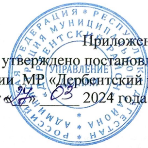
Схема размещения нестационарных объектов потребительского рынка на территории Муниципального района «Дербентский район» - п. Белиджи

Приложение №8 утверждено постановлением администрации МР «Дербентский район» от 24 03 2024 года № 24