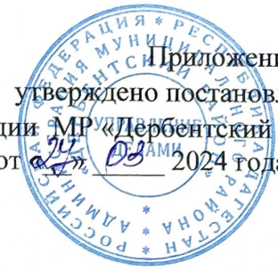
Схема размещения нестационарных объектов потребительского рынка на территории Муниципального района «Дербентский район» - с. Рубас

Приложение №10 утверждено постановлением администрации МР «Дербентский район» от 27.03 2024 года № 4