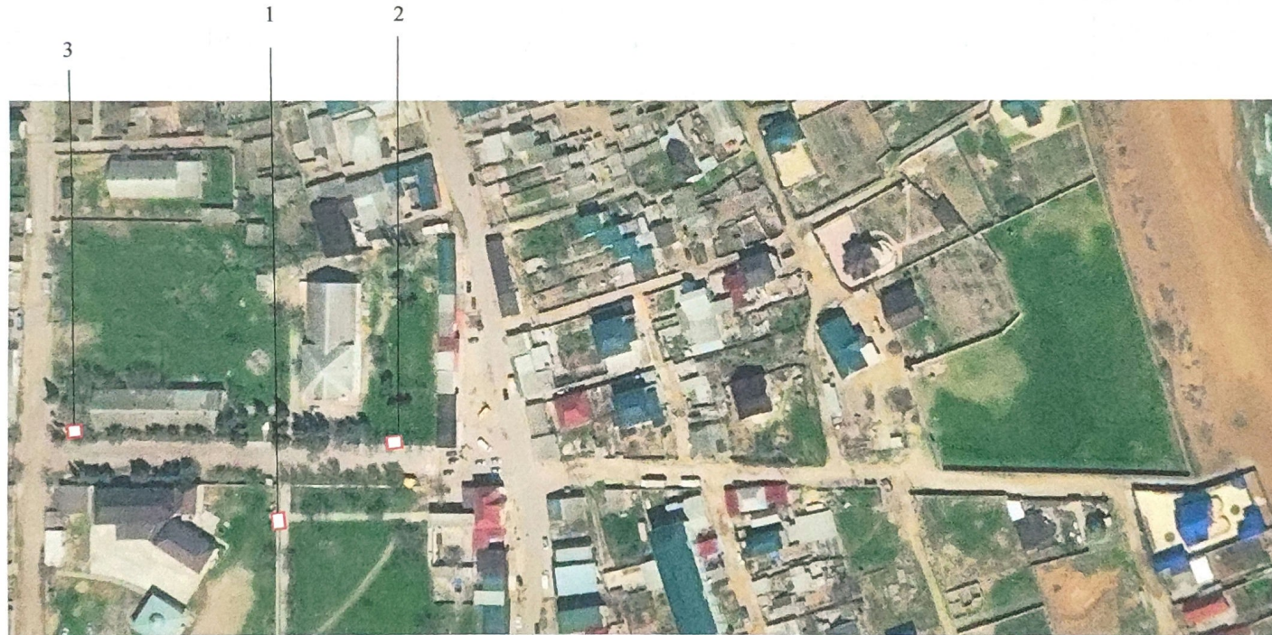
Схема размещения нестационарных объектов потребительского рынка на территории Муниципального района «Дербентский район» - с. Хазар

Приложение №1 утверждено постановлением администрации муниципального района «Дербентский район» от « 24 » Март 2024 года № 44