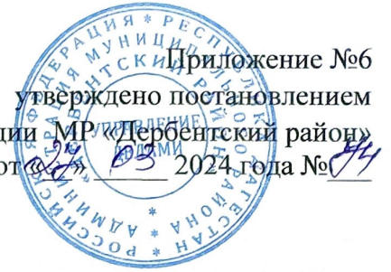
Схема размещения нестационарных объектов потребительского рынка на территории Муниципального района «Дербентский район» - с. Геджух

Приложение №6 утверждено постановлением администрации МР «Дербентский район» от « 03 » 03 2024 года № 44