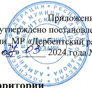
Схема размещения нестационарных объектов потребительского рынка на территории Муниципального района «Дербентский район» - п. Мамедкала

Приложение №7 утверждено постановлением администрации МР «Дербентский район» от «24» 03 2024 года № 17