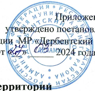
Схема размещения нестационарных объектов потребительского рынка на территории Муниципального района «Дербентский район» - с. Сабнова

Приложение №9 утверждено постановлением администрации МР «Дербентский район» от 07.05.2024 года № 34