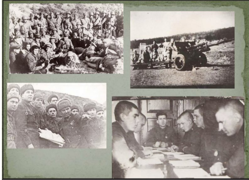
На фото: 345 Дагестанская стрелковая дивизия. Так все начиналось...